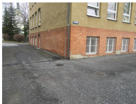
Foto stávající stav - jihozápadní